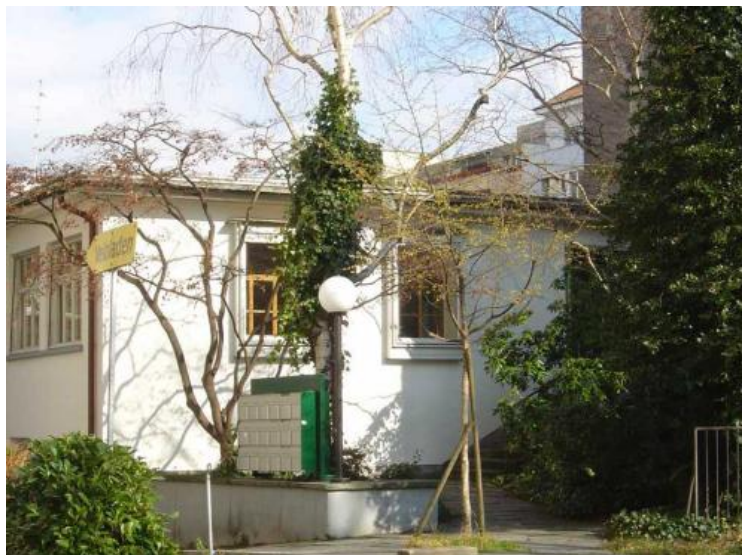
Vom Bahnhof SBB, Ausgang Gundeldingen in wenigen Minuten zu Fuss erreichbar.