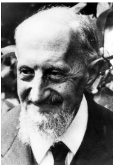
Dr. Roberto Assagioli

Begründer der Psychosynthese ist der Italiener Roberto Assagioli (1888-1974). Als Arzt und Psychiater setzte er sich Anfang des 20. Jahrhunderts intensiv mit der Psychoanalyse auseinander, erkannte für sich jedoch bald deren Grenzen, die er in seiner Doktorarbeit über Psychoanalyse (1911) kritisch formulierte: Die Vorstellung eines ausschliesslich von seiner Vergangenheit und seinen biologischen Trieben konditionierten Menschen erschien ihm zu eng. Seine Überzeugung war es vielmehr, dass wir als Menschen zutiefst spirituelle, geistige Wesen sind, eingebunden als Einzelne wie als gesamte Menschheit in den permanenten Entwicklungsprozess eines höheren Unbewusstes oder Überbewusstes. Ziel eines ganzheitlichen therapeutischen Ansatzes muss es deshalb sein, mehr Bewusstheit auch über diese unbewussten Vorgänge zu erlangen. Aus diesen Erkenntnissen entwickelte er die Psychosynthese als psychologische Methode zur Förderung des menschlichen Potenzials und der Selbst-Verwirklichung und wurde damit zu einem Vorreiter der humanistischen und transpersonalen Psychologie.